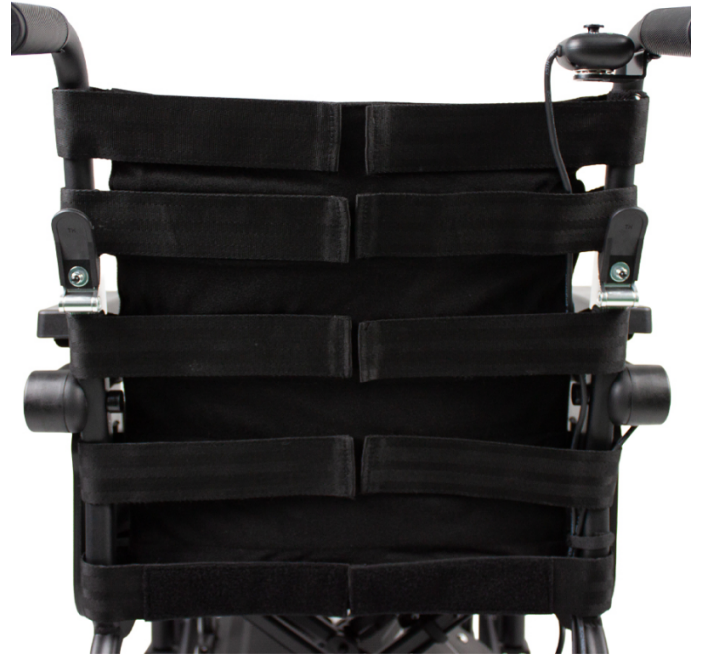
Tabla de medidas y modelos

El respaldo con tensores ajustables permite adaptar el soporte a la postura del usuario, mejorando la comodidad, la estabilidad y el posicionamiento durante el uso.