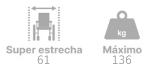
Tabla de medidas y modelos

La silla R 200 de construcción robusta y potentes motores es la versión más compacta. Con un ancho total de solo 61 cm, es la silla ideal para uso en la ciudad o en espacios reducidos. La anchura entre brazos es regulable de 41 a 48 cm.