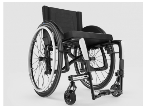
CHASIS ACABADO CARBONO CON DETALLES DE COLORES