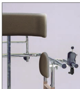
Accesorio Ref.: 857 Empuje lateral para pelvis