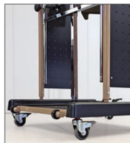
Accesorio Ref.: 861 Juego de 4 ruedas con freno