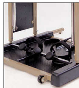
Accesorio Ref.: 902 Sujeta-pies anterior con correas