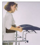
Posicionamiento de la mesa