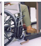
Posicionamiento de pies