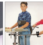
Standy 3 para niños de 8 a 14 años. Cierre del soporte posterior.