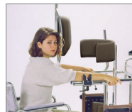
Posicionamiento de los brazos