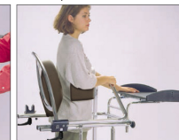
Cierre del soporte posterior