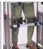
Posicionamiento de las rodillas y pies