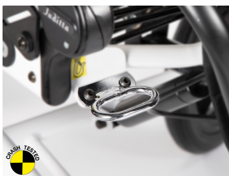
891 Anclajes para vehículo. Para anclar la silla en los vehículos homologados de transporte. Sólo para modelo B30 y B60.