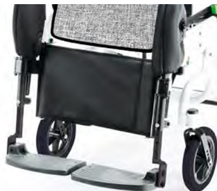
916 Acolchado para pantorrillas.