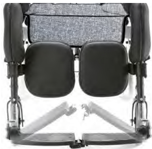
914 Bloqueo para plataformas de reposapiés. Bloquea las dos plataformas para formar un único pie.