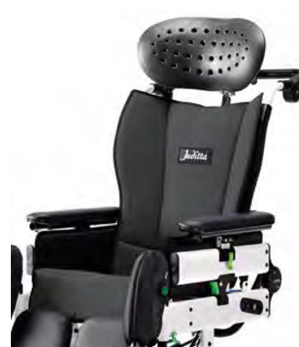
938 Tapizado asiento completo impermeable.