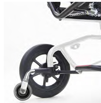
932 Antivuelcos solo para B30 (de serie en modelo B60).