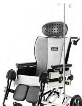
933 Porta sueros. Disponible para los modelos B30 y B12.