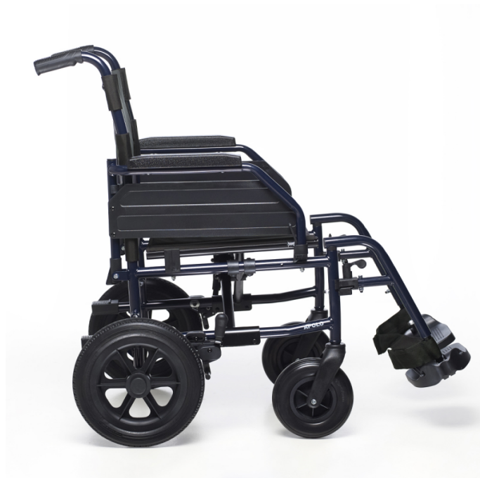
Versión Transit (PL70)

También disponible con ruedas antipinchazo de tránsito, de poliuretano y de 12" (305 mm) de diámetro. La silla es más estrecha, aunque debe ser empujada por un asistente.