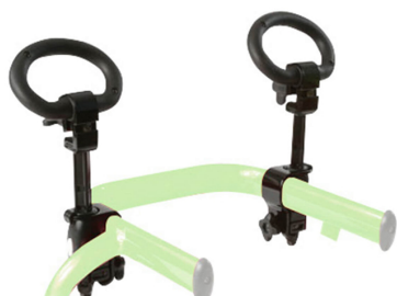
Asas para las manos Ref.: TK 1010