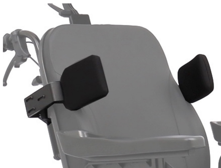
Soportes laterales (Ref. A827A-01)