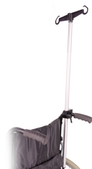
Portasueros (Ref. H113400)