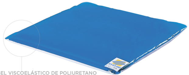
GEL VISCOELÁSTICO DE POLIURETANO DE ALTO RETICULADO

→ Evita la migración del gel y previene el efecto de fondo de las protuberancias óseas.