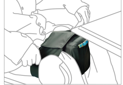
EN UNA SILLA