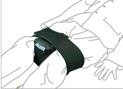
EN LA POSICIÓN SUPINA