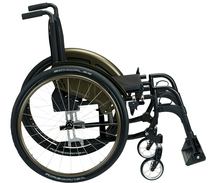
Tabla de medidas: anchos y fondos de asiento disponibles

Reposabrazos de altura regulable opcionales