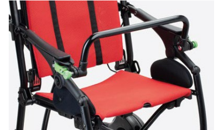
839 Manillar delantero Ajustable en inclinación. Fácilmente extraíble para poder plegar la silla.