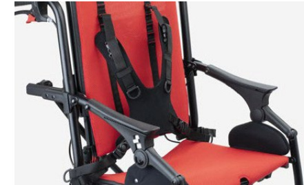
853 Arnés de 4 puntos