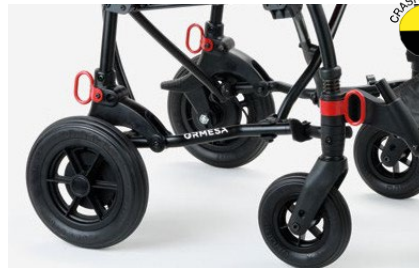
891 Anclajes para transporte en vehículos Para el transporte de la silla en un vehículo (coches, buses..).