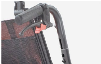
951 Puños regulables en altura Aumenta la altura total en 7 cm (de 94cm a 101 cm)