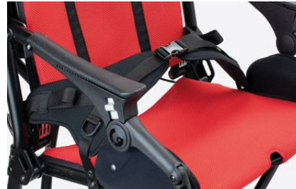
920 Cinturón pélvico de 4 puntos Disponible en dos tallas.