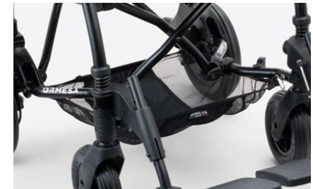
858 Cesta de almacenamiento