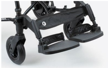
960 Cinta para las taloneras