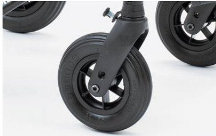
812 Bloqueo de dirección para las ruedas delanteras