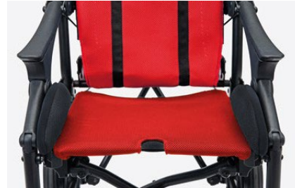
958 Soportes laterales de pelvis