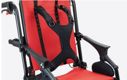
853 Arnés ligero de cuatro puntos.