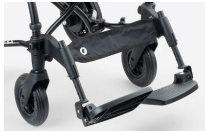
956 Plataformas ajustables en inclinación