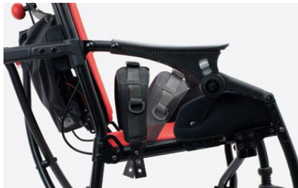
947 Cinturón pélvico de 2 puntos Disponible en dos tallas.