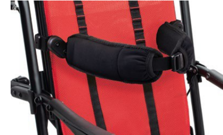
868 Soportes envolventes y flexibles de tronco. Permite ajuste en altura, anchura y rotación,