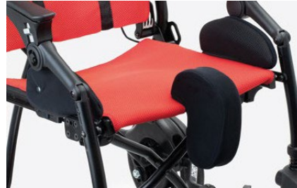
834N Taco abductor Fácilmente extraíble. Disponible en dos tallas.