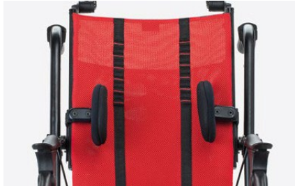
838 Soportes laterales de tronco Se pueden ajustar en altura, anchura y rotación. Esta disponible en dos tallas.