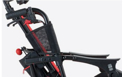
844 Fundas de protección para los laterales