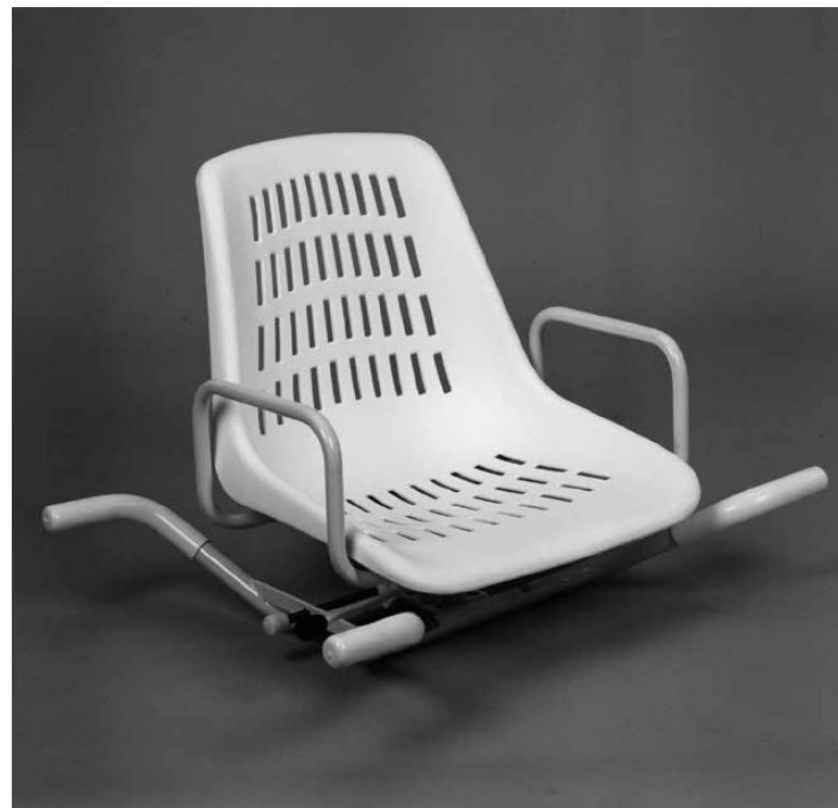
ASIENTO GIRATORIO DE BAÑERA (AD536-I)